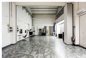
SPAZIO 3 E 4