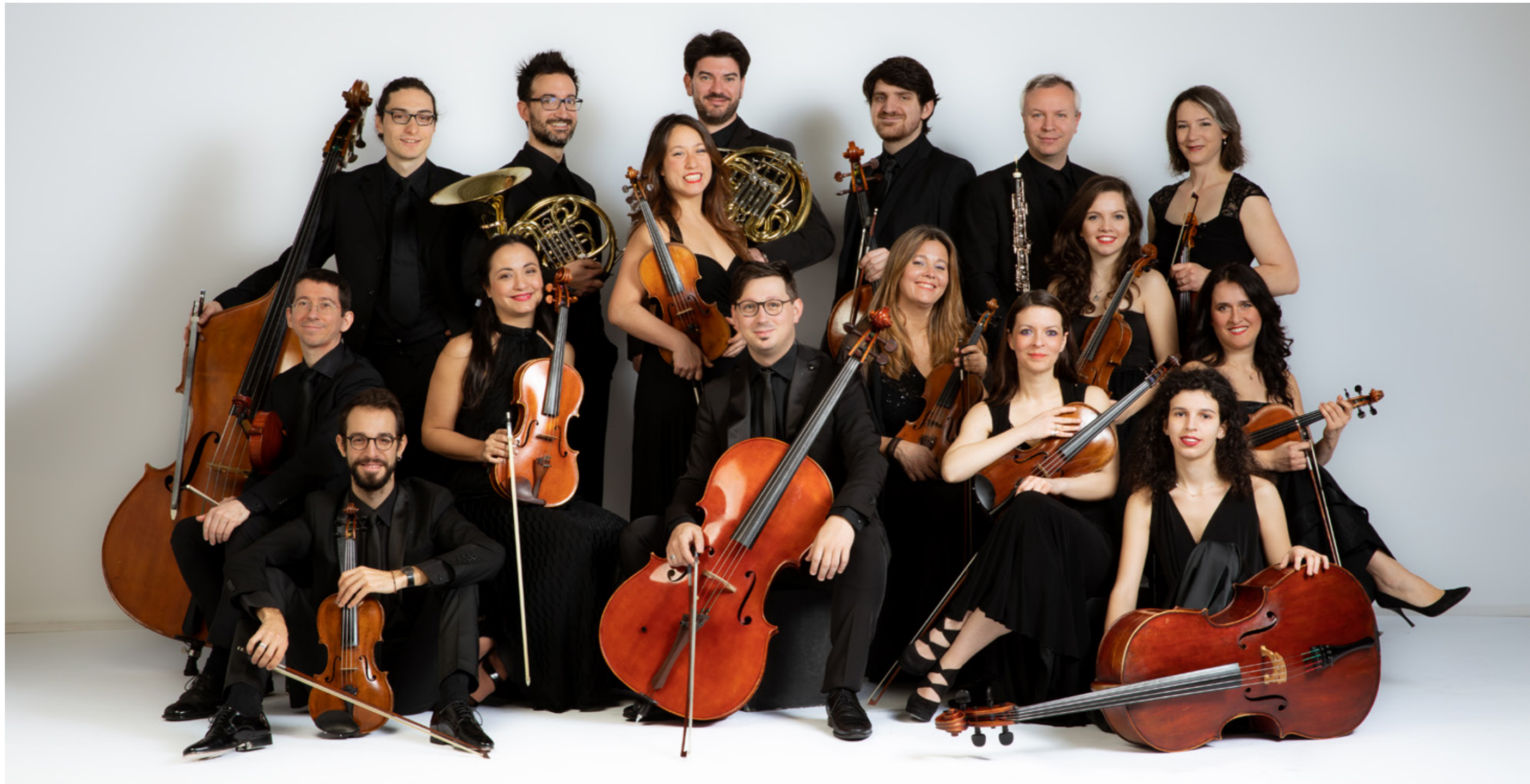
Orchestra Milano Classica