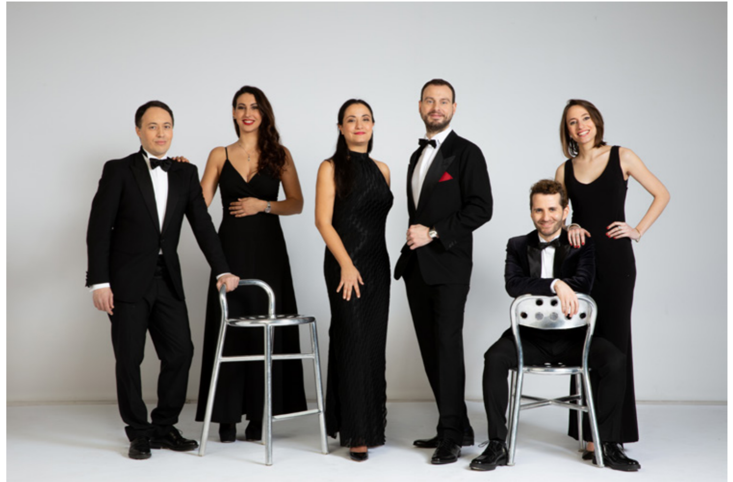
Lo staff di Milano Classica