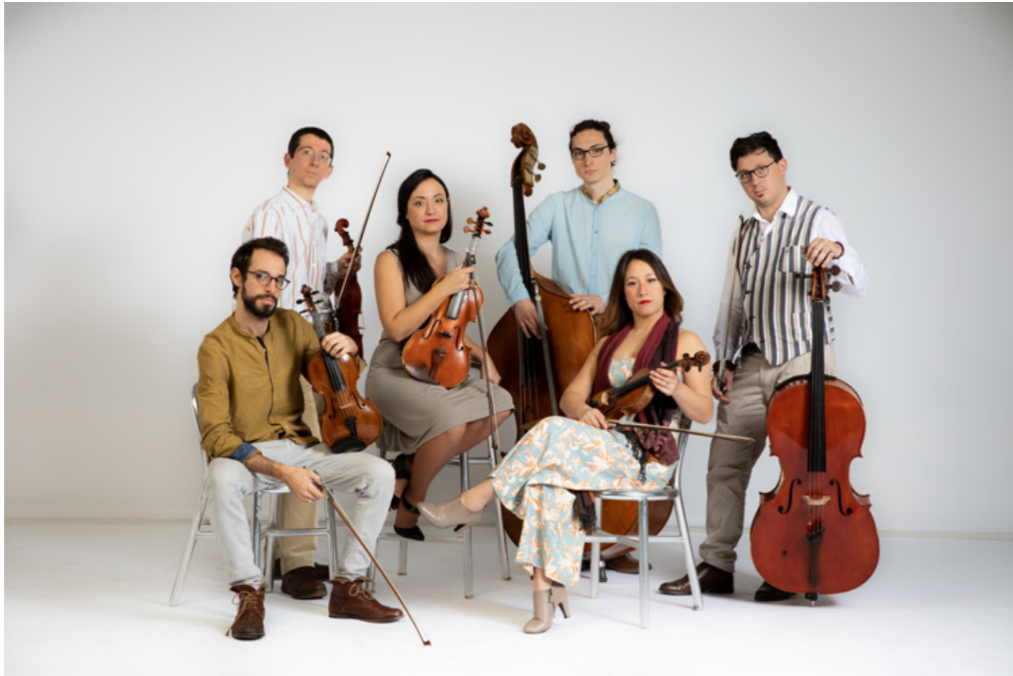
I Solisti di Milano Classica